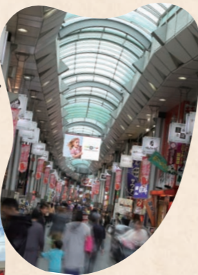
ハッピーロード 大山商店街